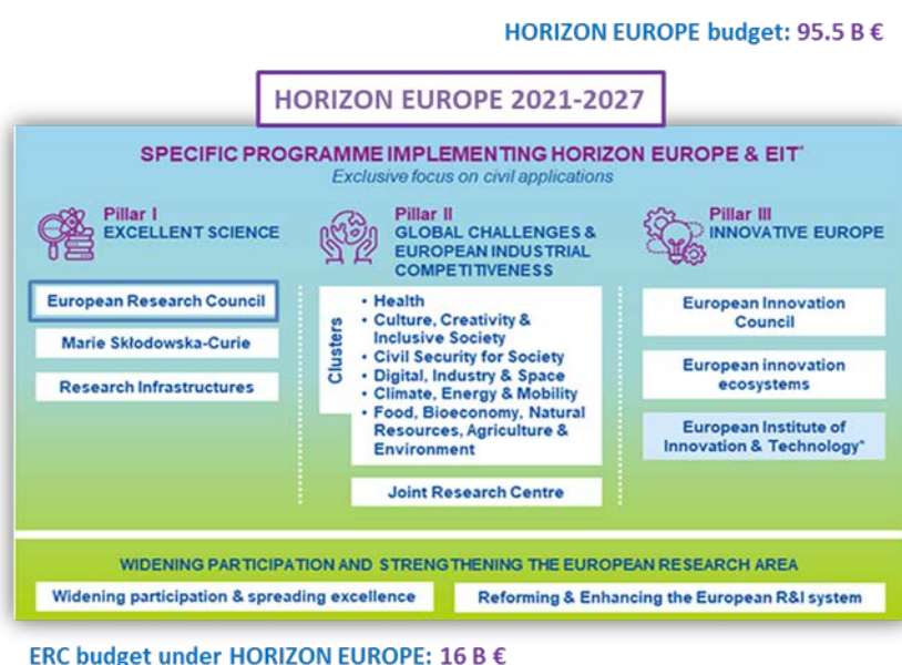
Figura 1. Structura Programului-cadru Orizont Europa (2021-2027)

Consiliul European pentru Cercetare (European Research Council – ERC) face parte integrantă din Pilonul I – Excelența Științifică al Programului-cadru pentru Cercetare și Inovare Orizont Europa 2021-2027 (HE) (Figura 1). Programul-cadru al Uniunii Europene pentru cercetare și inovare, Orizont Europa (HE), are o durată de 7 ani (2021-2027) și mobilizează un buget total de 95,5 miliarde de € 1 . Pilonul I al HE – Excelența Științifică este finanțat cu 25 miliarde € din care 16 miliarde € sunt alocați pentru ERC, reprezentând 17% din intregul buget al HE.