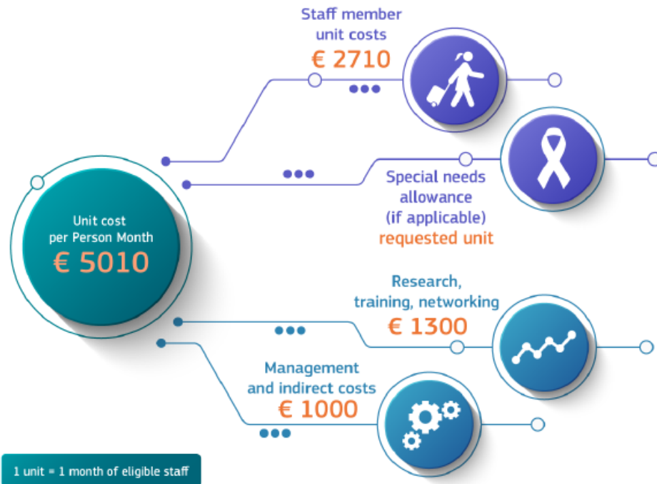
Figura 3. Contribuțiile unitare pentru MSCA Staff Exchanges 4